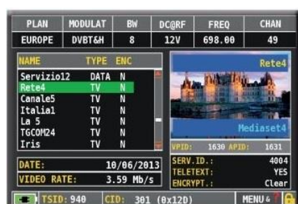
LISTA DOSTĘPNYCH PROGRAMÓW